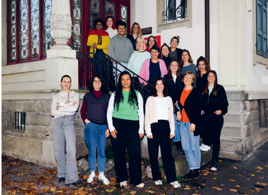
Das Frieda-Team im November 2025.

Im Jahr 2025 führte die Frieda-Partnerorganisation Artpolis ihr Engagement gegen sexuelle und geschlechtsspezifische Gewalt weiter und setzte sich im gesamten Kosovo kraftvoll für mehr Bewusstsein rund um psychische Gesundheit, Geschlechtergerechtigkeit, Anti-Diskriminierung und die Stärkung junger Menschen ein. Mit dem Projekt Ndal – Stopp! verwandelte sie unterschiedlichste Orte – von Theatern bis zur Strasse – in lebendige Räume für Dialog, Reflexion und gemeinsames Handeln gegen Gewalt jeglicher Art. So erreichte sie über 7400 Menschen.